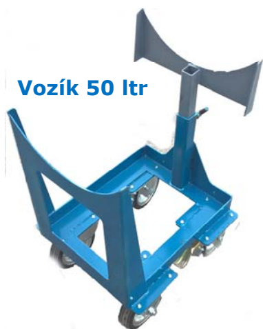
Vozík 50 ltr